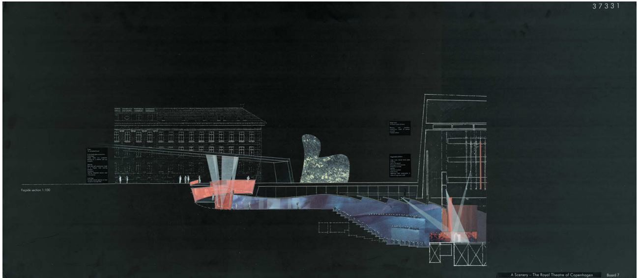
Theater in Kopenhagen

373301 Theater Kopenhagen Wettbewerbsprojekt HNF 15.738 m 2