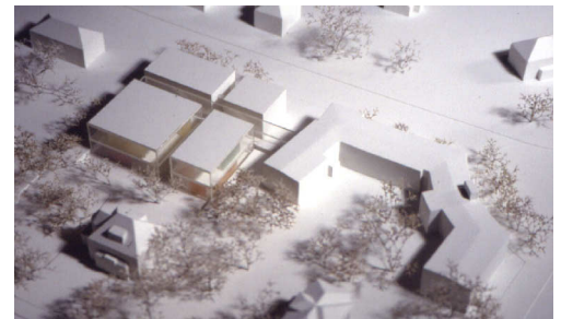
Palucca Schule Dresden

323301 Panoramalift Königstein competition liftbox size 11 m 2 ca. 3.500.000 DM