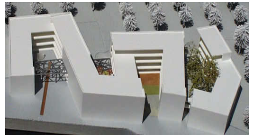
Kreishaus Hameln Modell

343301 Technologie Highschool in Holzminden Competition entry HNF 2.632 m 2 ca. 16.650.000 DM