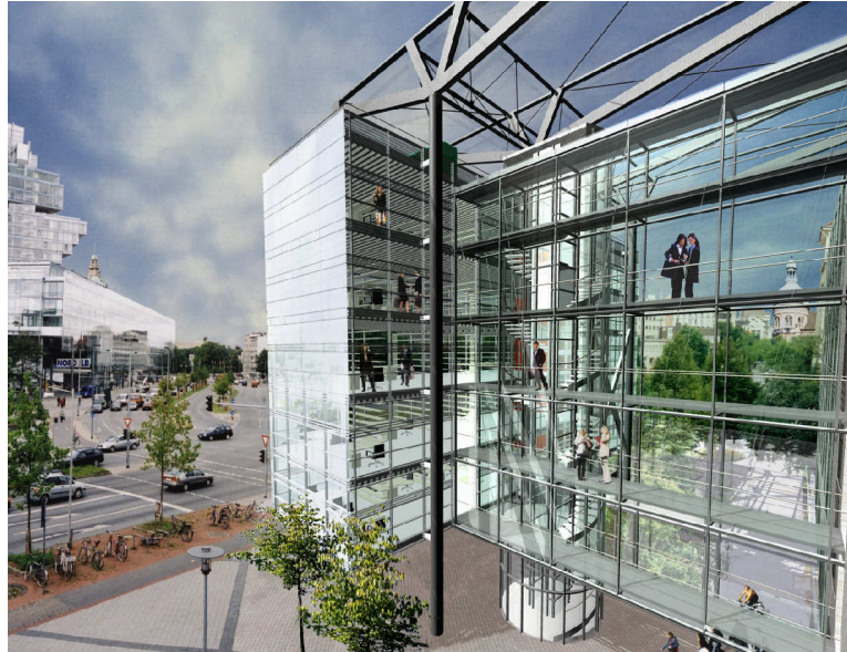
Torhaus am Aegidientorplatz

202 Torhaus am Aegidientorplatz Hannover NILEG Hannover, in Planung HNF 9.000 m 2 ca. 12.000.000 Euro