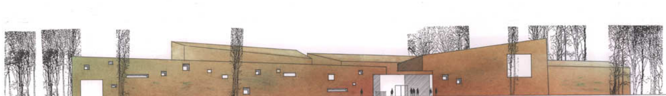
Musikakademie und Jugendgästehaus Wolfenbüttel